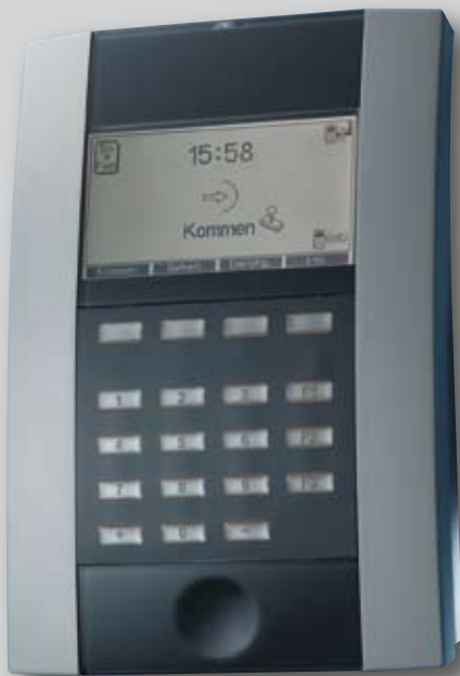
Vielseitig, leistungsfähig und ergonomisch: die Zeiterfassungsterminals der Serie TRS 3000